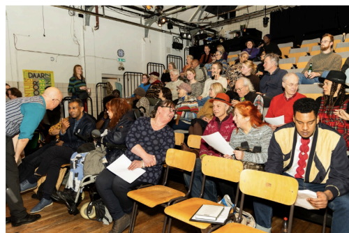
→ De workshops van Kantlijn trekken een breed publiek van 'kleurrijke mensen die de wind niet mee hebben'.